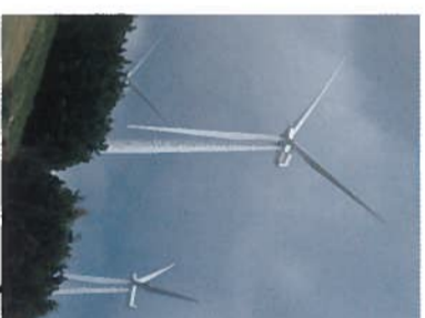
from Wind farms