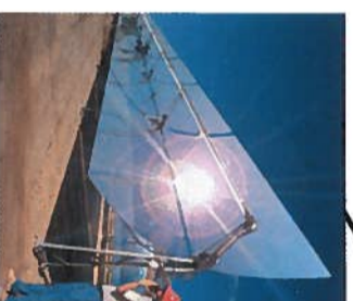
from Thermodynamic Solar